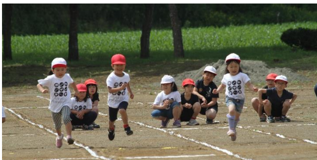
走りも演技もお返事も素晴らしかった、保育所の皆さん！