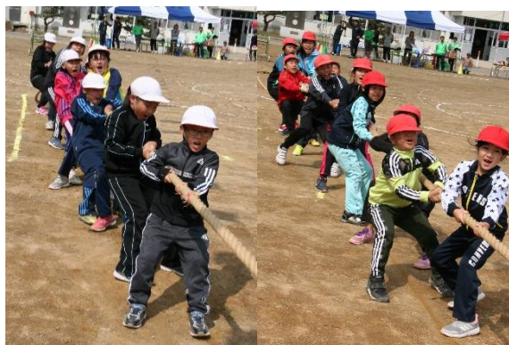
白組が維持を見せました。綱引き