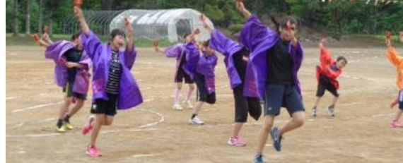
はじける演技が最高でした！よさこいソーラン

今年も よさこいチーム Exclamation(エクスクラメーション) の皆さんにご指導いただきました。