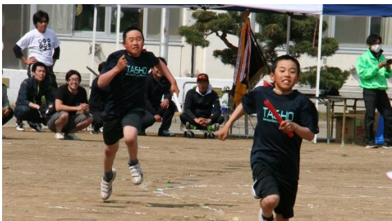
優勝の行方は、最後のリレーへと！