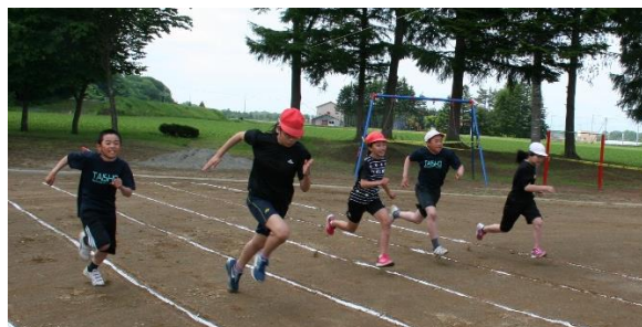
徒競走、最終レースの6年生は大接戦！

今年も盛会のうちに、無事、運動会を終えるこ とができました。皆様のご協力、ご支援の賜と心 より感謝申し上げます。ありがとうございました。