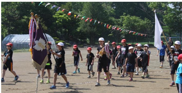
さあ!!!いよいよ第113回大運動会の始まりです

児童の部も、町内会の部も最後の一種目を残して同点という、白熱した展開となり、児童の部は赤組が、町内会の部は愛国北町内会が優勝しました。思い出と感動一杯の大運動会を開催できたのも、皆様のご協力、ご支援の賜と心より感謝申し上げます。大変ありがとうございました。