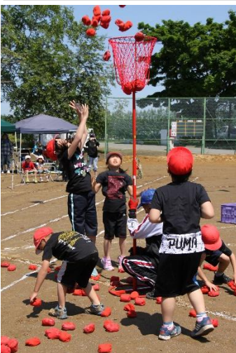
赤組のチームワーク