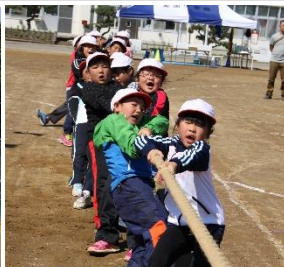
優勝目指す白組パワー