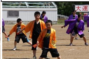
息の合ったヨサコイ