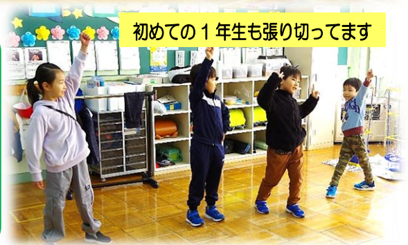
初めての1年生も張り切ってます

準備・練習 中も素敵な 姿がたくさん 見られました。 当日 もどうぞお 楽しみに！