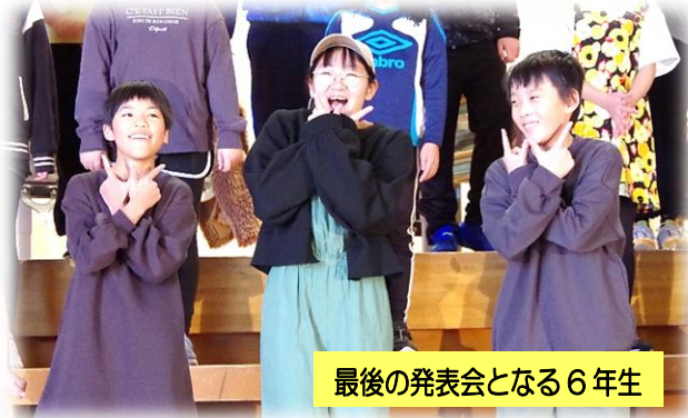
最後の発表会となる6年生

いよいよ明日は学習発表会です。子どもたち一人一人がこれまで取り組んできた学習や練習の成果を生かし、それぞれの持ち味を存分に発揮する姿が今からとても楽しみです。一人一人が自分らしく輝き、見ているお客さんも発表している自分自身も感動ができるよう、みんなで力を合わせて発表しますので、ぜひ子どもたちの姿をご覧になり体育館まで足を運ぶください。お待ちしております！