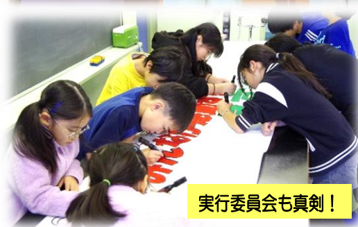
実行委員会も真剣！

準備・練習 中も素敵な 姿がたくさん 見られました。 当日 もどうぞお 楽しみに！