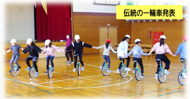
伝統の一輪車発表